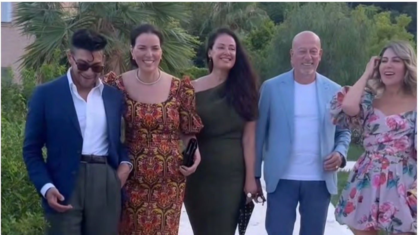
Scarpe e borse negli Usa Il viaggio di sei influencer

Hanno visitato il distretto fermano con un pregetto di Svem e Regione per raccontarlo in rete