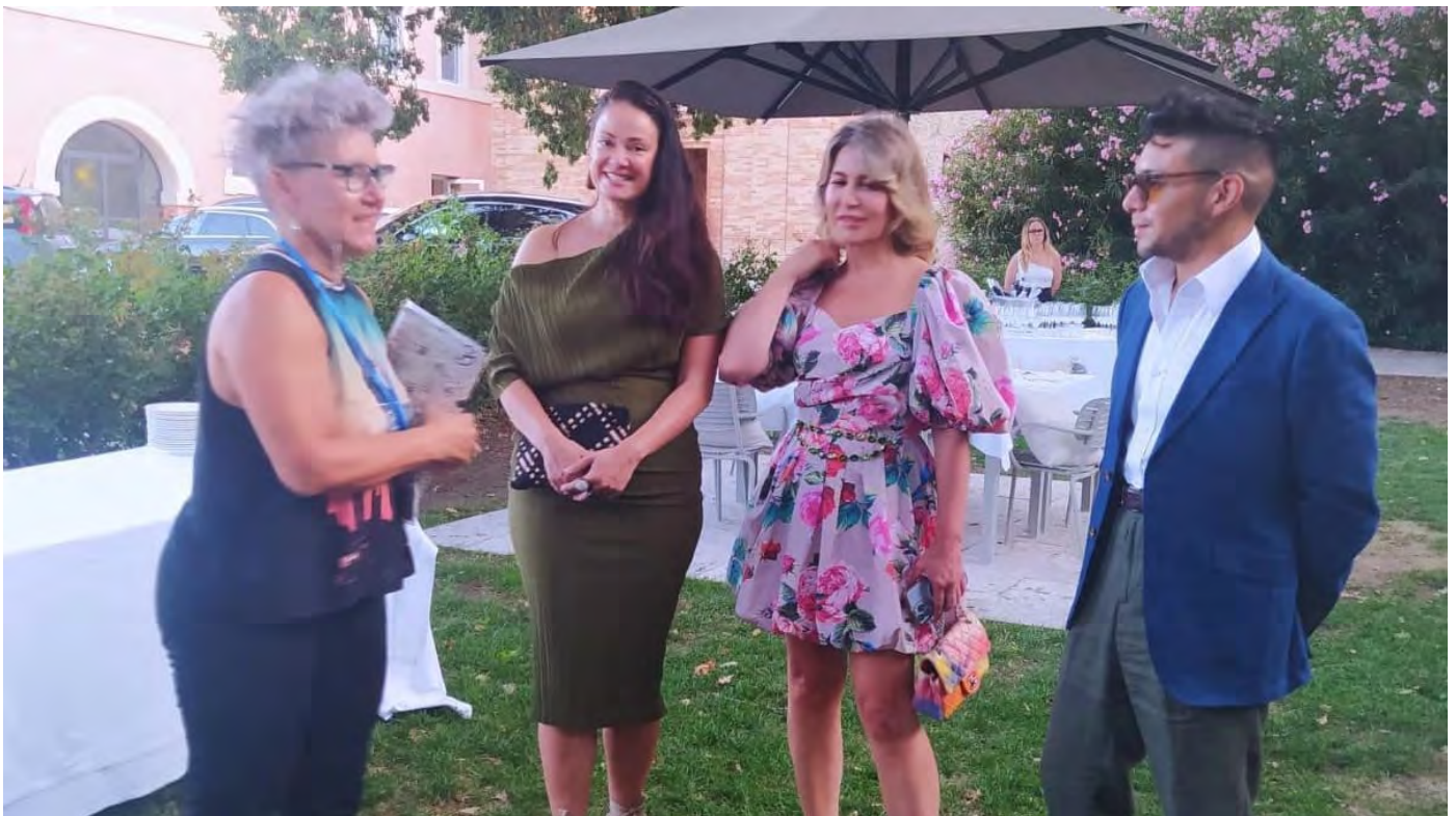
Sei influencer dagli Usa al Fermano

Per tre giorni visiteranno imprese e faranno un viaggio nella moda grazie al progetto 'Oltre Frontiera'