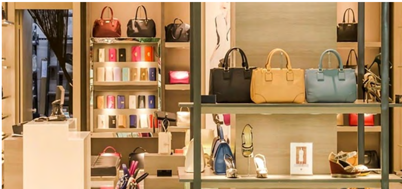
Vetrina moda Marche

Economia Sei influencer dall'America alle Marche per valorizzare calzature e pelli: il programma